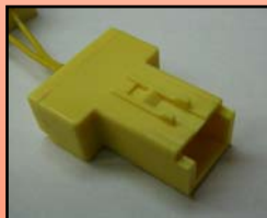
D-2 主に トヨタ スズキ