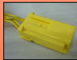
D-8 主に ホンダ