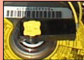
D-4 ※注 主に 汎用