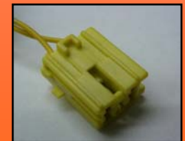
D-13 主に スズキ

※注：D-4とD-9の写真は車両側の 配線を表示しています。またメーカーに より色や形状が異なりますので代表的な 形状を表示しています。