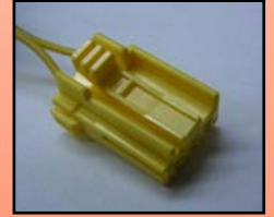
D-5 主に ホンダ