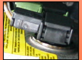
D-9 ※注 主に 三菱 外車