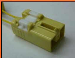
D-11 主に マツダ