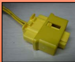
D-6 主に ホンダ イスズ