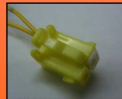
D-12 主に ダイハツ