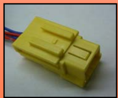
D-7 主に ホンダ 三菱