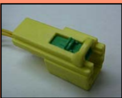
D-10 主に スバル