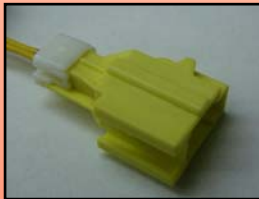
D-3 主に 日産